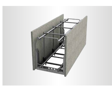
MBA® SYSTEM [ ALS RINGBALKENSCHALUNG ]